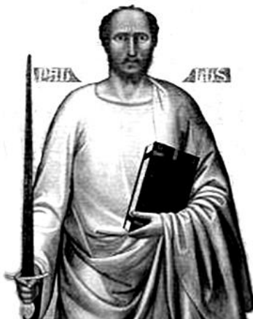
Paulo de Tarso por Bernardo Daddi c. 1333

“E agora, irmãos, vos encomendo a Deus e à palavra de sua graça, àquele que tem poder para edificar e para dar herança entre todos os santificados.