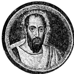
Paulo de Tarso

© A Autêntica Sabedoria Cristã do Apóstolo Paulo